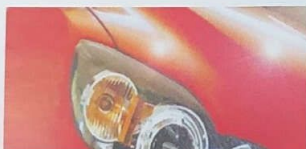
BEHANDELT MIT 100 PLUS